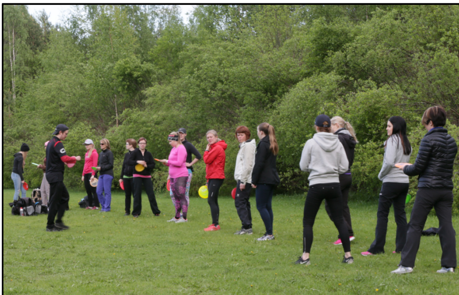
Frisbeegolfopastusta naistentapahtumassa kesäkuussa 2015