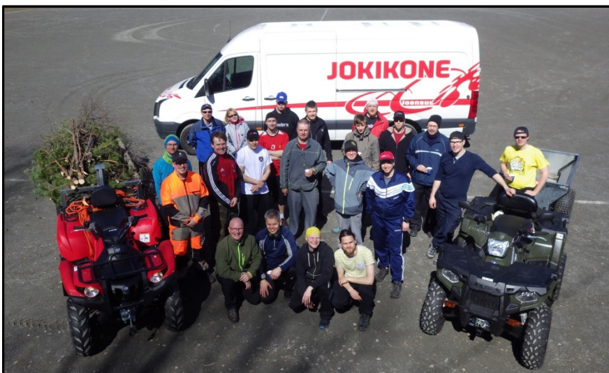
Utran frisbeegolfradan talkooporukkaa toukokuussa 2015 (kuva: Mikko Makkonen)