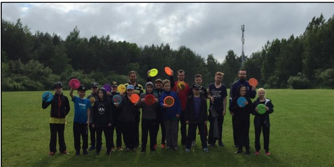
Juniorikerholaiset, kesäkuun 2015 ryhmä