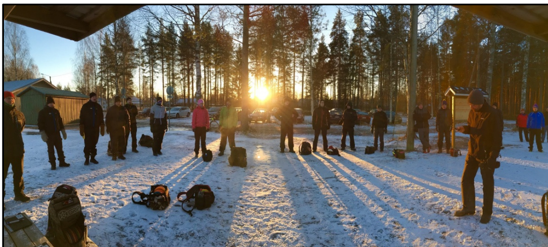
Viikkokisojen pelaajakokous joulukuun auringossa